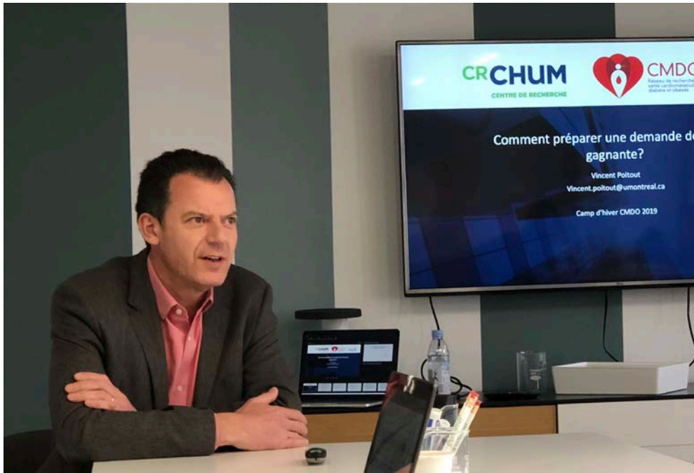
Atelier de Vincent Poitout